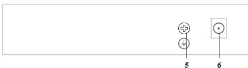
Рисунок 2 - Эскиз задней панели коммутатора.